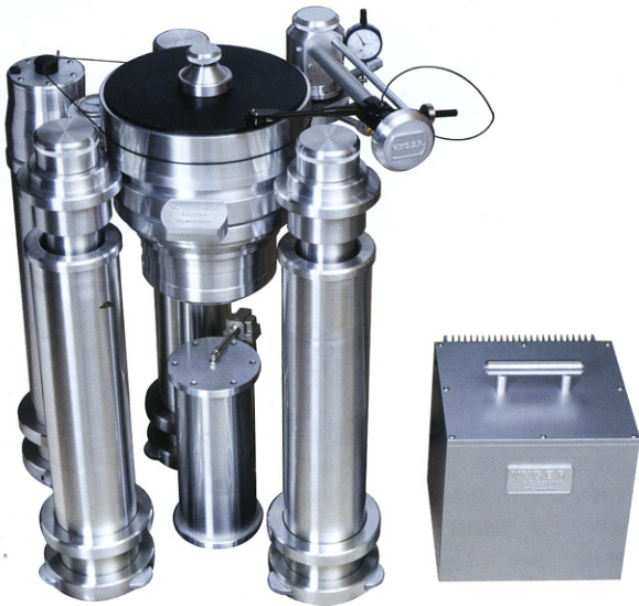
수입원 : 오디오갤러리 (02)926-9084 · 가격 : 6,800만원

이는 철재 새시에 완벽하게 아이솔레이션시킨 구조적인 특징이 큰 몫을 하는 것 같다. 장착된 톤암은 리니어 트랙킹 방식이다. 컴프레서에 의해 톤암이 부양된 상태에서 작동하는 구조인데 이 경우 톤암 레일을 따라 이동 시 저항을 최소화시킬 수 있는 형태로 일부 메이커들도 도입하고 있는 구조이다. 압파이프 재질은 카본의 채용하여 각종 공진에 강하며 낮은 질량으로 인해 리니어 트랙킹 방식에 적합하다.