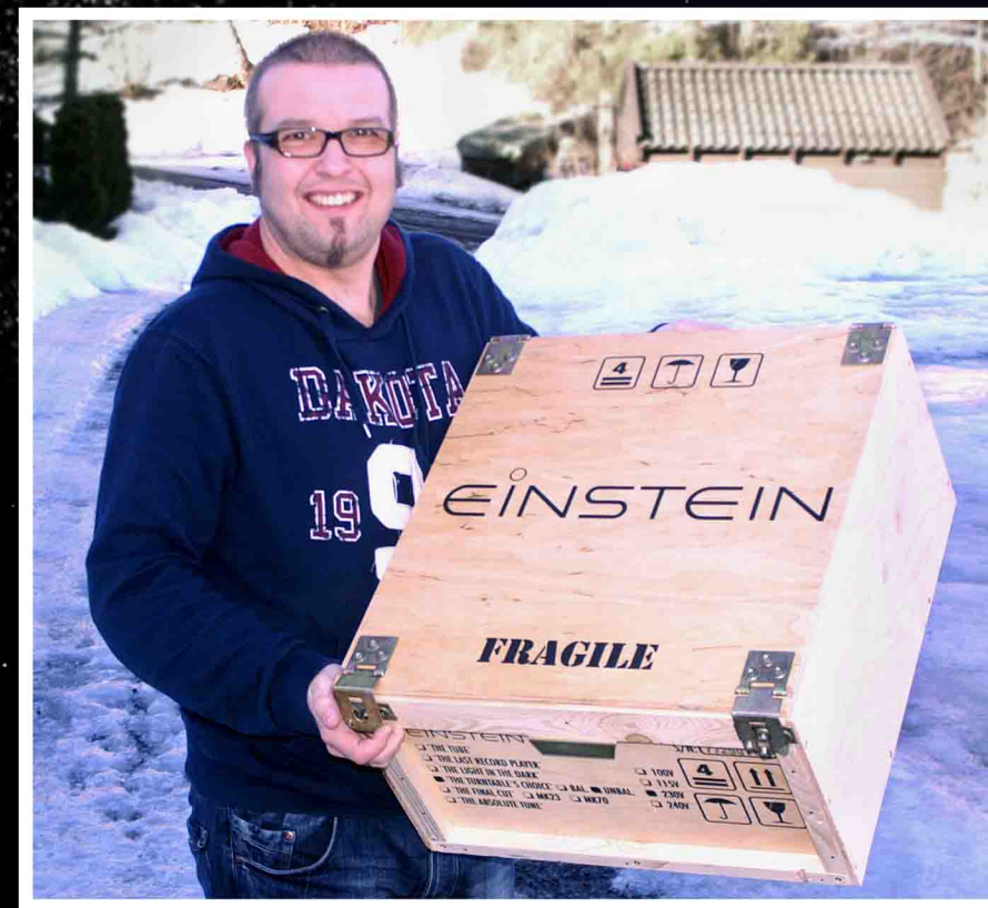
Stor kasse for liten RIAA. Takk til Jørn på Living Sound for utlån av testobjektene.

Einstein EMT TU3 - perfekt match? Importøren Audio Royal har valgt å matche denne drivverk/arm-kombinasjonen med Einsteins EMT TU3 moving coil pickup. Om dette skyldes flaks eller beregning vet jeg ikke, men dette utgjør en bortimot perfekt match sammen med platespilleren. Sist jeg testet andre EMT-pickuper var tilbake på slutten av 80-tallet. Dengang var lyden preget av en utrolig bassgjengivelse men med relativt liten oppløsning oppover i mellomtone og diskant. De klassiske EMT-ene var vel mer morsomme enn de var korrekte. Denne karakteren finner en i en viss grad igjen i den moderne EMTen.