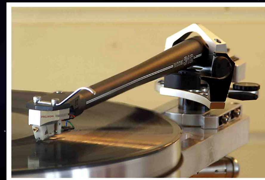
SME 312 tonarm er standard

Sammen med spiller/armkombinasjonen fikk jeg også med importørens anbefalte pick-up og RIAA - begge fra den tyske produsenten Einstein. Pick-upen med betegnelsen Einstein EMT TU3 og produseres for Einstein av det tyske firmaet EMT. Dette er en stiv low output moving coil som bør passe bortimot perfekt i armen. Det hører med til historien at dette er en av de aller verste pick-upene jeg har vært borti når det gjelder montering. Vi snakker om en helt naken pick-up der alle de vitale og sansible delene er farlig utsatt for vær, vind og skelvende fingre. At det i tillegg er ugjengede monteringshull i braketten så løse muttere må benyttes gjør ikke jobben