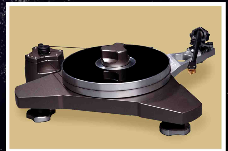
V.Y.G.E.R. Baltic M i Antrasitt utførelse

er som sagt den nest minste modellen i sortimentet. Men det hadde kanskje passet bedre å kalle den for den 4. største for dette er en spiller som virkelig er synelig på toppen av raket. Vi snakker om en solid treeiket kladass CNC-maskinert i massiv aluminium. Selve chassiset, platepucken og den frittstående motorenheten er lakkert i valgfritt rødt, blått, sølv eller antrasitt. Armbasen er i ulakkert aluminium. Chassiset kobles til - eller snarere avkobles fra - underlaget via tre høydejusterbare føtter - også disse utført i aluminium - med motfasede magneter som holder platespilleren "nesten" svevende i fri luft. Nesten siden toppdelen av de tre føttene entrer tre matchende sylindriske hull der magnetene sitter innerst. Dette gjør koblingen til bena magnetisk men også pneumatisk. Lageret er værdt et kapittel for seg selv. Det er det kraftigste lageret jeg har vært borti på noen platespiller og kunne sannsynligvis gjort nytte som hjulager på en liten familiebil. Det er freset ut tre spalter i foringen i lageret med