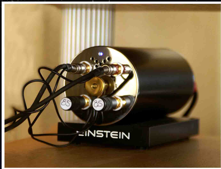
Tubulær Bells; Einstein "The turntables Choice".

her er det vanskelig å bedømme enkelt-komponentene. Da armen er en fot lang passer den ikke på noen av de andre plate-spillerne jeg har tilgjengelig. Da drivverket er forberret for nettopp denne armen har jeg heller ikke muligheten til å prøve noen av mine egne armer på spilleren. Man må teste kombinasjonen som en enhet. Men dette har ikke hindret meg i å gjøre noen tanker om de enkelte delene. Begynner vi med armen må jeg si at den imponerer meg skikkelig. Den eneste 12" jeg har erfaring med fra tidligere er SMEs egen 3012 arm. Den gamle S-formede klassikeren er langt bedre enn sitt rykte og utgjør en ideell partner for pickuper som EMT, Denon DL-103, Koetsu og Ortofon SPU. Men sammen med mer moderne (dvs. mykere) pickuper er den her testede SME